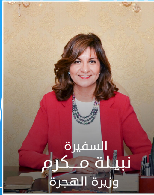
السفيرة نبيلة مكرم وزيرة الهجرة